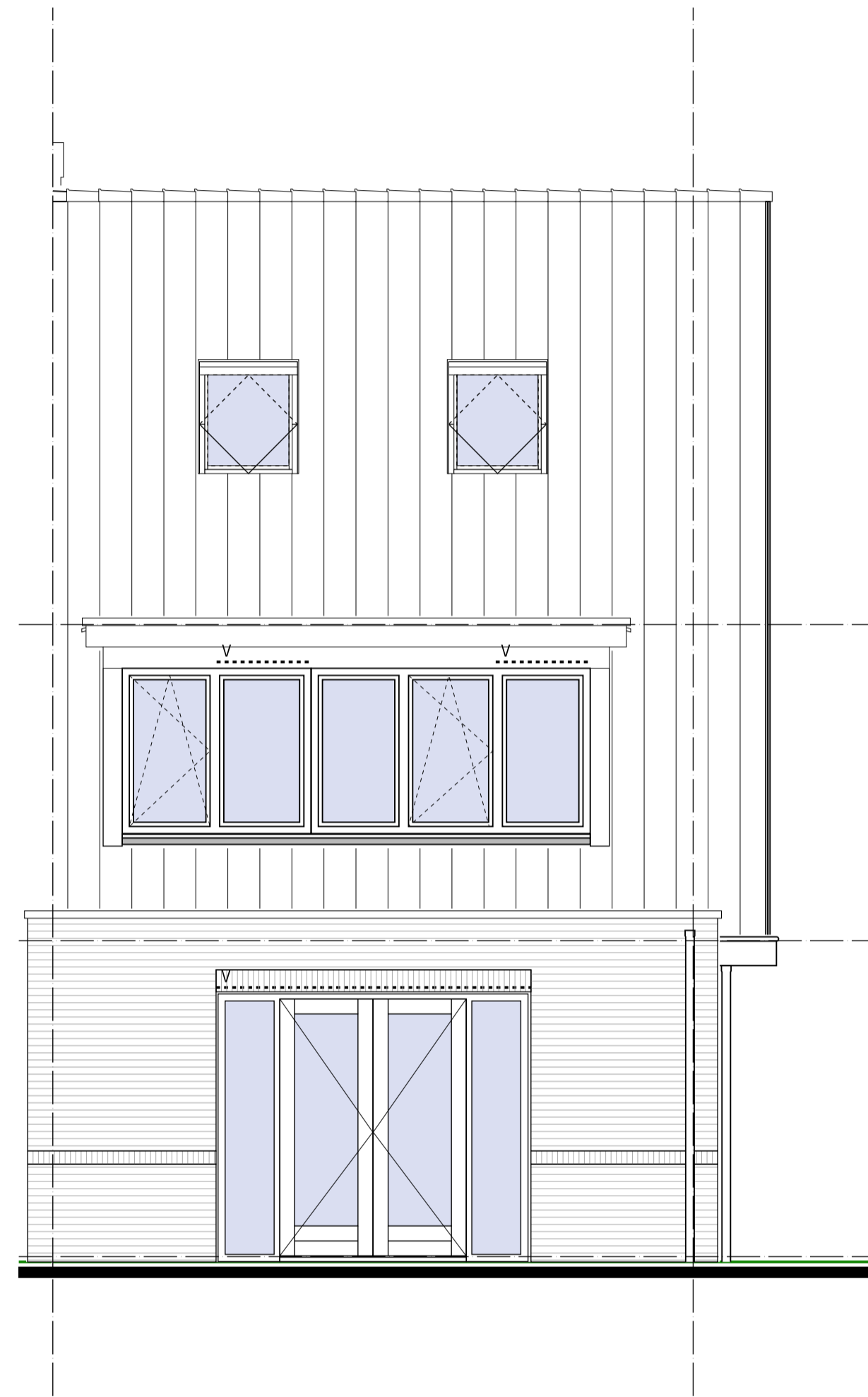
Achtergevel type E - Optie dakramen 2e verdieping - Optie uitbouw 1,2 meter (getekend) - Optie uitbouw 2,4 meter - Optie dubbele openslaande deuren