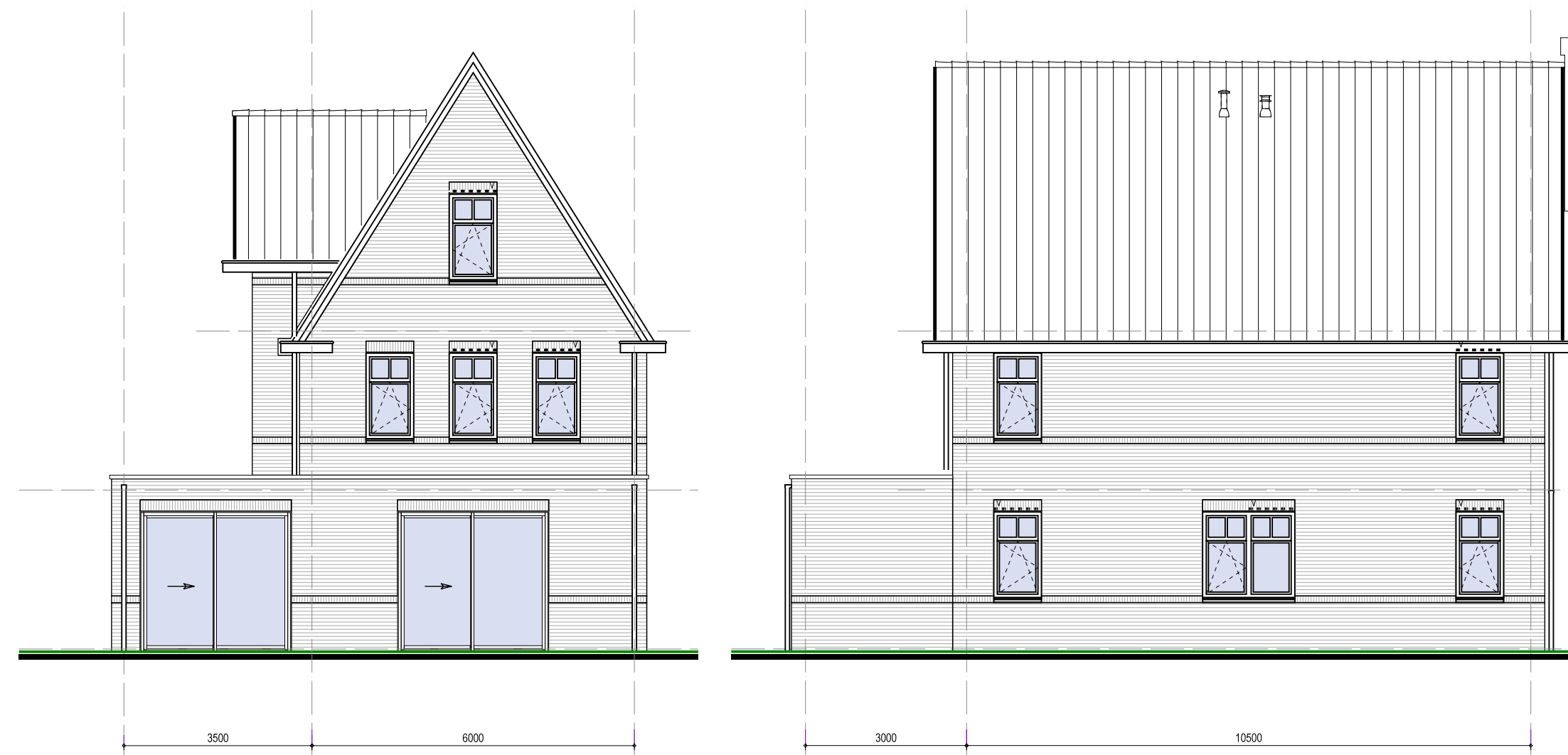
Achtergevel type Da2 en Da3