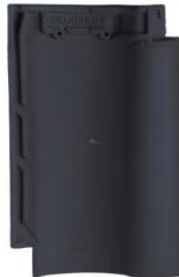
Pan 3 - Grijs