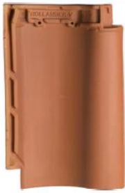
Pan 2 - Rood